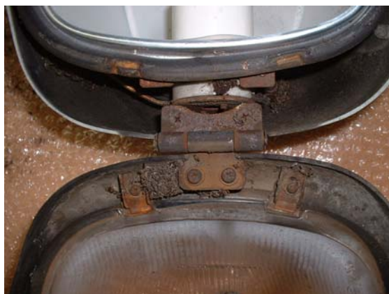
部品が錆びた状態で使用