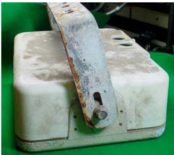
屋内用器具を雨がかかる場所に設置