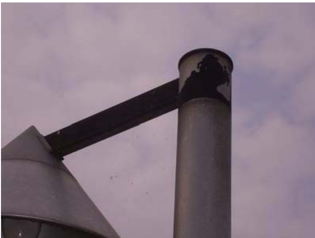
非耐塩屋外用器具を海岸隣接地域に設置