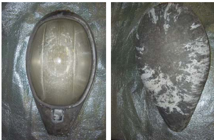
塗装が劣化した状態で使用