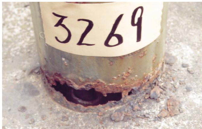
孔があいた状態で使用