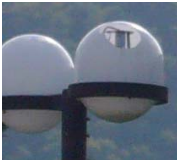
器具が破損した状態で使用