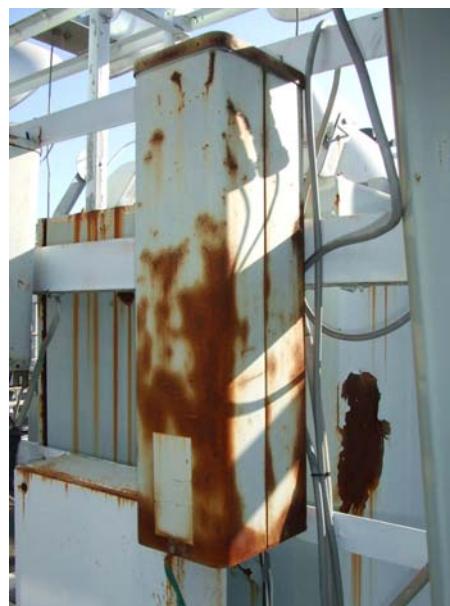
錆びた状態で使用