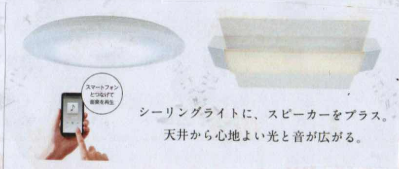
スピーカー付シーリングライト

本物の空みたいは しょうめいです。 雨の日もはれの気 もちになれる。 びかりまでさいげん されていて、本物 のまどみたい だった。